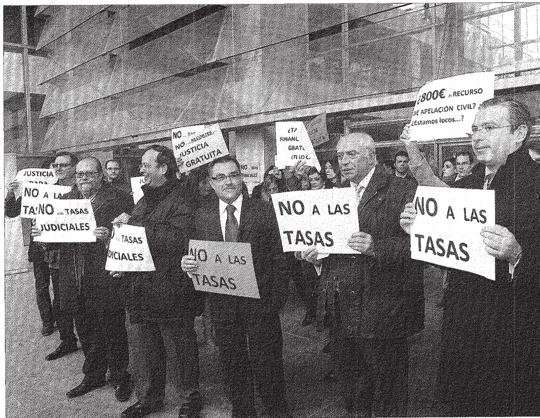
Arteche (5) y Vallejo (4) se sumaron a la protesta junto a abogados en los Juzgados y Tribunales de Ciudad Real.