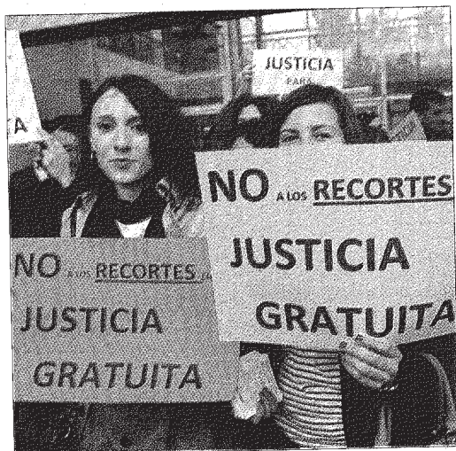
Los letrados defienden una Justicia para todos sin recortes y límites al derecho.