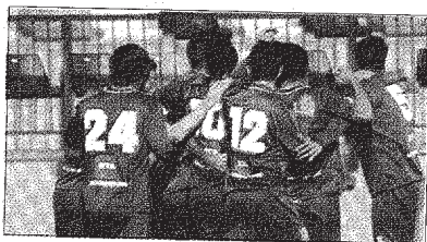
Los jugadores locales celebran su primer tanto.