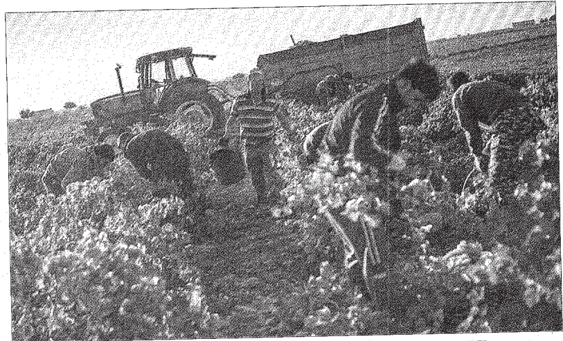
Varias personas recogen uva en la provincia de Ciudad Real durante la campaña de este año.